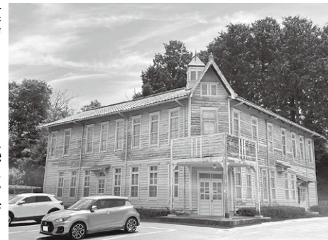
ロマンに満ちた旧波田町役場庁舎

また、秋の祭典を迎える前の行事として、風祭りという祭事も開催しています。波田地区の中では、いくつかの町会でこの祭事が行われていると聞いています。22区町会では、8月21日に開催され、氏子総代をはじめ、農家組合員、町会役員、公民館役員の総勢11人が参加して、公民館南側の外壁に祀つてある祭壇の前で祈願しました。 風祭りという祭事は、立春から二十日経った時期に、台風等の風水害が多いとされていて、その影響を受けて農作物に被害が及ばない様に、風害防除を目的として祈願する祭事と言われています。 一般的に秋祭りは、農作物の収穫に感謝し、奉納することで神様をもてなす意味があり、その前に風祭りで被害を防ぐ祈願をするといった伝統行事がこれからも町会で受け継がれていくことを願っています。