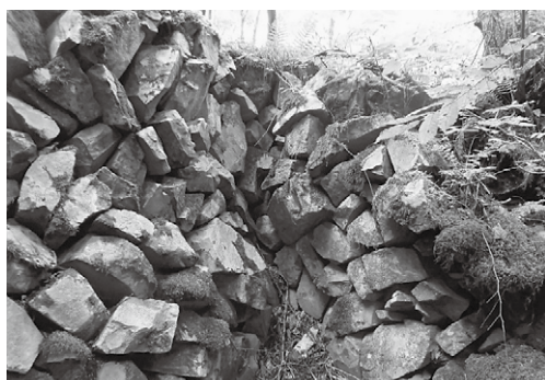
歴史を感じる石積み

原団地分譲開始の頃に現地へ撮った写真を集録した50年近く前のアルバムです。当時私の勤務先は、東京に本店がある松本支店でした。住居は、城山公園のふもとにある家族寮（社宅）です。各県に支店があり、転勤の多い会社でした。さらにその頃から目立ち始めたのは、単身赴任者の増加でした。私も10年後には単身赴任をすることは確実だと思いはじめました。「これからその対応策を考えなければ」と、手をこまねいている期間が半年を過ぎた昭和51年（1976年）3月のことです。長野県企業局の新聞広告で「波田北原団地の宅地分譲」を知ったのです。妻の実家が波田の三溝で、頻繁に出掛けてはお世話になっていたので、下島駅と妻の実家の周囲にまとまる一族の家屋敷風景だけが私のもっている波田町に関する知識の全てだったのです。