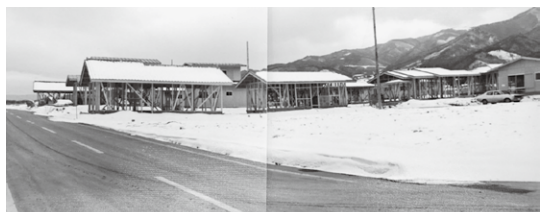
住宅が建ちだした当時の北原団地(写真は昭和52年頃)

また、別の日に、波田町役場を中心にした地すく学校、中学校、図書館、運動施設、商工会館等が団地から徒歩10分程度の距離にあり、満足しました。分譲を受けた区画も決まったので、必要書類を整えている時、この団地で本当にいいのかという疑念がわいてきたのです。翌日役場へ行き、団地について問い合わせると、職員の方から「波田病院をご覧になりましたか?」と聞かれたのです。医療施設も近くにあるのかとわかった瞬間、私の気持ちは分譲を受け入れる決意に戻りました。 「思い出」は、書棚整理というきっかけによって、過去の記憶を呼び戻してくれました。懐かしさを感じながらも、これからの住み慣れた地域で生活していきたいと思っています。