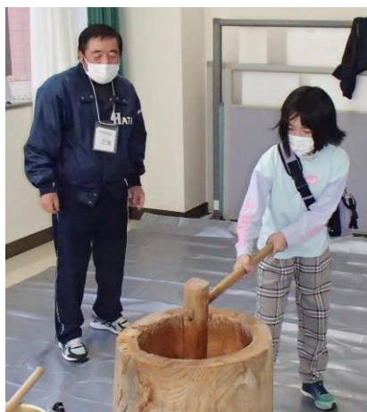
(餅つき体験の様子)

新型コロナウイルス感染症拡大により中止となっていた波田文化祭が、11月5・6日の2日間、3年ぶりに開催されました。