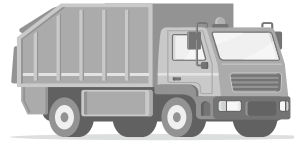
パッカー車(積込量2トン) 23,500台分!

少しの間で可燃ごみを減らし、リサイクルできる資源になります。これからはプラスチックごみの分別を意識しましょう。