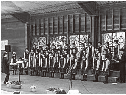
今年4月に行われた夫婦堤音楽祭の様子

5月からは2類感染症から5類に移行していく中で、子供たちの笑顔が戻り、活動かえってくる事を期待します。