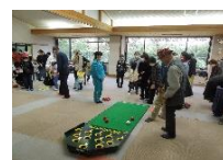
教養娯楽室も お賑わい