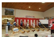
中学合唱部皆さん 素敵なお歌声でした

各イベント等、たくさんの皆様に盛り上げて いただきました。ありがとうございました。