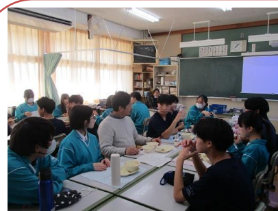
中学校の交流給食の様子